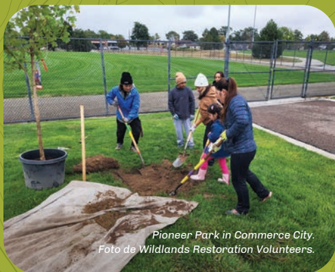
Pioneer Park in Commerce City.

Con la ayuda de una subvención de $147,092, Wildlands Restoration Volunteers se asoció con las organizaciones Promotores Verdes y Cultivando para ampliar el acceso a los espacios naturales y desarrollar la capacidad de la comunidad para hacer frente a las desigualdades medioambientales en Aurora y Commerce City. Los residentes están plantando árboles en áreas de bajo dosel, recogiendo semillas y apoyando las plantas autóctonas, y haciendo que los espacios al aire libre sean más acogedores y accesibles para diversos residentes.