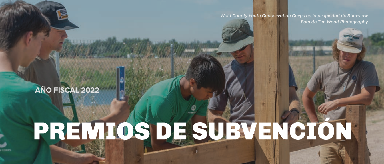
Weld County Youth Conservation Corps en la propiedad de Shurview.