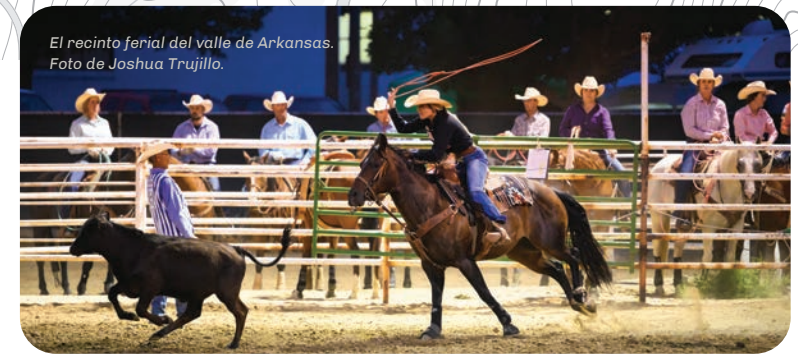
El recinto ferial del valle de Arkansas.

Los $10 millones concedidos al Trust for Public Land, en colaboración con The Nature Conservancy y Gunnison Ranchland Conservation Legacy, fue la subvención de una sola transacción más grande en la historia de GOCO, destinada a proteger a Trampe Ranch, de 4,377 acres en el condado de Gunnison en 2016. Conservar a Trampe significaba proteger alrededor del 20% de la productividad agrícola del condado, una milla del río Gunnison, tres millas del río East, vistas espectaculares desde las carreteras del área y senderos populares, el hábitat del urogallo de Gunnison, alces, ciervos mulos, osos negros, leones de montaña, aves migratorias y residentes, y rapaces.