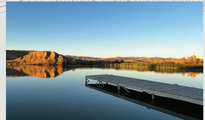
Parque Estatal Highline Lake.

Las inversiones de GOCO a través de CPW también apoyan la programación juvenil, ya que CPW se encuentra en una posición única para introducir a los jóvenes de Colorado a las actividades al aire libre. Al exponerlos a posibles carreras relacionadas con los recursos naturales, fomentar más actividad física, y crear conciencia sobre las actividades recreativas al aire libre, la gestión de la vida salvaje y la protección de los recursos naturales, la asociación ayuda a cumplir el objetivo a largo plazo de crear futuros administradores de la tierra y la vida silvestre.