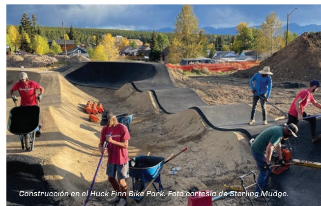
Construcción en el Huck Finn Bike Park.