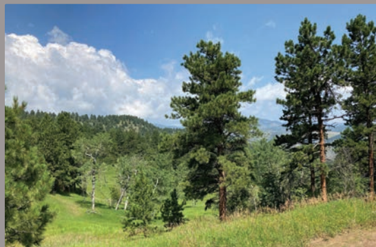
Custer Wash South.

Por promedio, los propietarios que deciden voluntariamente conservar sus propiedades con servidumbres de conservación pagan más de $50,000 en costos de transacción, una carga financiera que supone un obstáculo para algunos. Por segundo año consecutivo, GOCO invirtió en el programa Transaction Cost Assistance Program de Keep It Colorado ayudando a los fideicomisos de tierras sin fines de lucro a cubrir estos costos para los propietarios y conseguir la conservación de paisajes críticos. De este modo se apoyó la protección permanente de más de 2,400 acres de tierra en el año fiscal 2022.