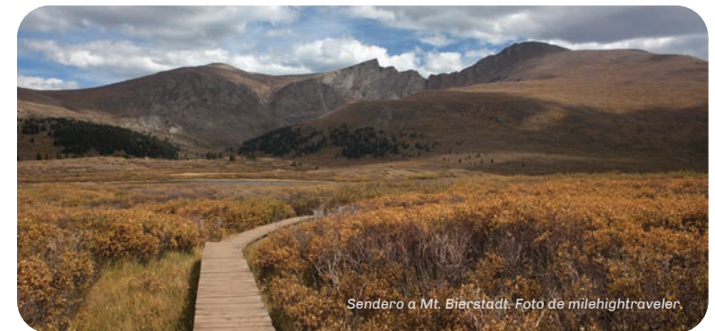
Sendero a Mt. Bierstadt.

La ciudad de Rocky Ford está planeando para el futuro de la feria estatal continua más antigua de Colorado, que lleva 145 años celebrándose, y de la propiedad adyacente de Crystal Lake. El objetivo es celebrar la historia y patrimonio local y, al mismo tiempo, apoyar la economía y el acceso a actividades recreativas al aire libre.