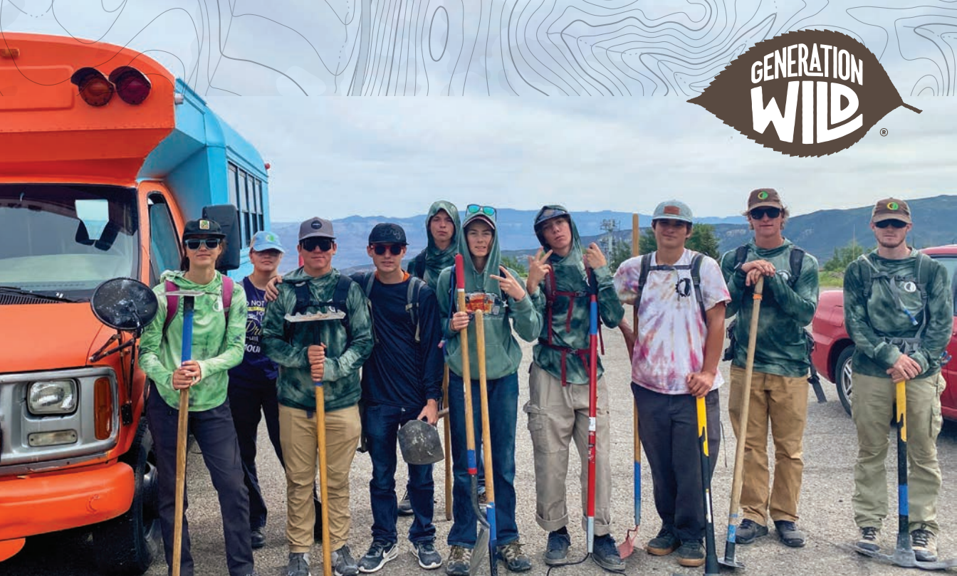
The Wilder Bunch.