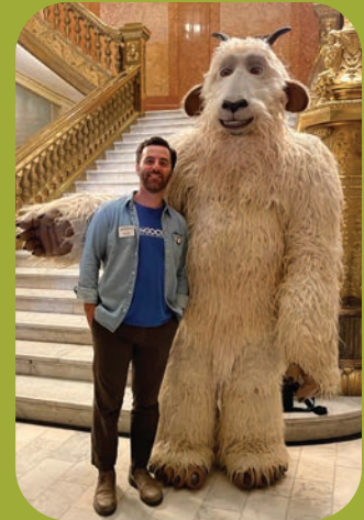
Página izquierda: Personal de GOCO y Civic Canopy en Crested Butte.