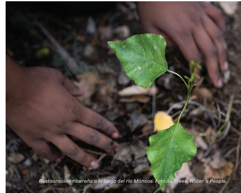
Restauración ribereña a lo largo del río Mancos.

hábitat han hecho que las comunidades de plantas de importancia cultural sean cada vez más escasas y amenazan la capacidad de la tribu para transmitir estos conocimientos a la siguiente generación. Gracias a este proyecto, nuestros socios esperan crear conjuntamente un plan de cosecha tradicional para garantizar la sostenibilidad del paisaje en el futuro.