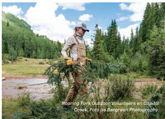
Roaring Fork Outdoor Volunteers en Capital Creek.

El valle de Roaring Fork, como muchas de las comunidades de montaña de Colorado, sigue